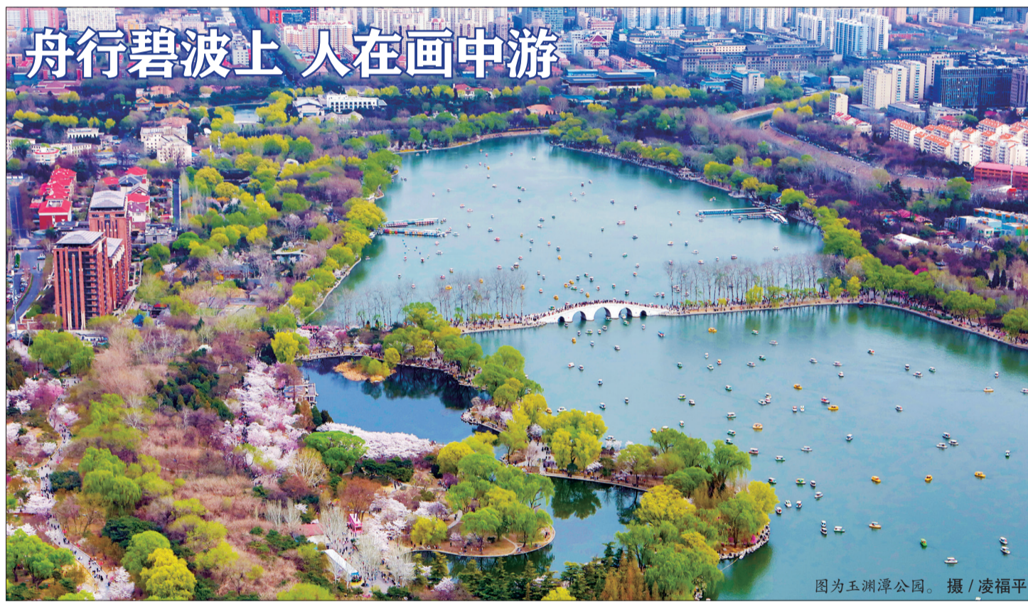
图为玉渊潭公园。

对于当前开展的北京市水务行业安全生产治本攻坚三年行动，刘斌强调，要强化责任落实，迅速组织开展节前安全大检查工作，强化安全措施落实，协同推动安全工作末端落实。对工作不落实、发生安全事故的单位、人员，要按照“一案双查”要求，依法依规追究主体责任和相关管理人员责任，以严的举措和作风保障各项工作责任落地落实。